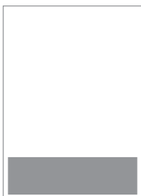
Piede 300 x 113 mm