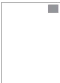
Manchette 46,5 x 56,4 mm

*per richieste fuori standard o per inserimenti di inserti i nostri commerciali sono a vostra disposizione