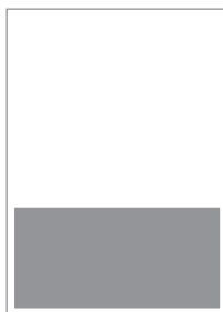
1/3 pagina 213 x 93 mm + 5 mm